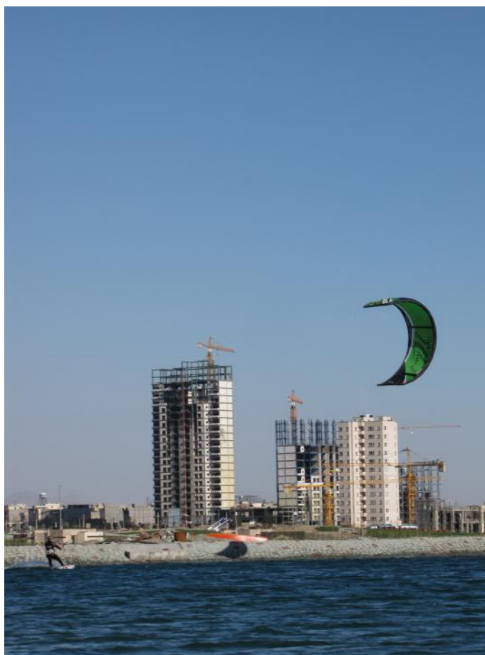
تمرینات کایت بوردینگ - تهران

با توجه به ارزان بودن (به نسبت قایق های بادبانی) و قابل حمل بودن تجهیزات کایت بوردینگ ( براحتی چند ست تجهیزات در یک دستگاه پراید جا میگیرد) وجود باد مناسب و آب (دریا ، دریاچه های مصنوعی یا طبیعی) امکان فعالیت در این رشته تقریبا در تمامی استانها وجود دارد. حتی استانهایی که دارای امکانات مذکور نیستند می توانند در قالب اردوهای تمرینی به استانهای همجوار جهت تمرینات عزیزت نمایند. بعنوان نمونه هم اکنون برخی ورزشکاران استان فارس جهت تمرینات به بوشهر سفر می نمایند.