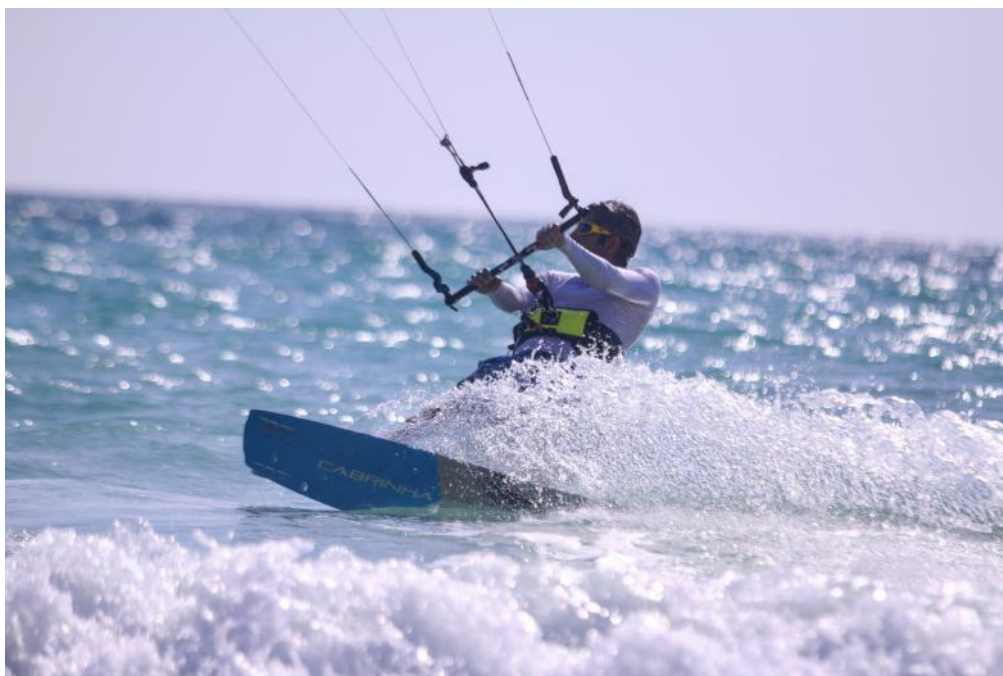
تمرینات کایت بوردینگ - جزیره کیش

ورزش کایت بوردینگ در سال ۱۳۸۹ توسط عده ای جوان علاقه مند که بواسطه فعالیت های ورزشی به خارج از کشور سفر کرده بودند وارد ایران شد. از آن زمان تاکنون بر تعداد رایدیتهای کایت بوردینگ افزوده شده و هم اکنون در سواحل بندرعباس، لنگه، کیش، قشم، بوشهر، دریاچه شهدای خلیج فارس (چیتگر) تهران، دریاچه سد سفید رود (منجیل) می توان ورزشکاران کایت بوردر را مشاهده نمود.